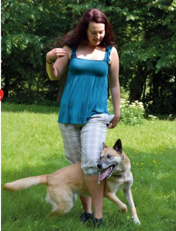
LÄRAKTIG. Semla kan hoppa över mattes ben och gå slalom.