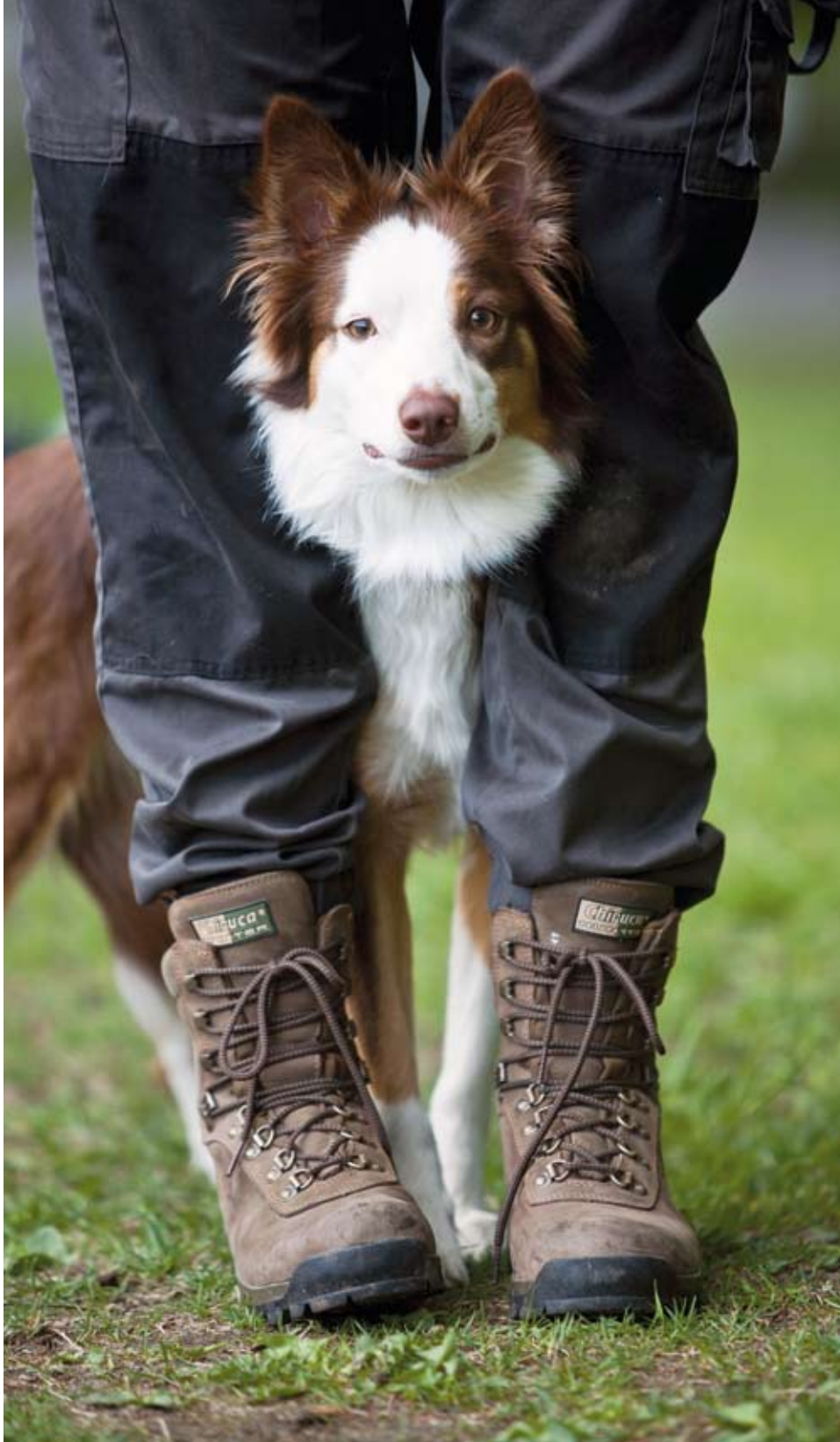
KLASSRUMSVOVVE. Hundarna får vara med även på teorilektionerna på August Kobbs gymnasium.