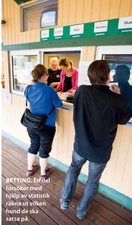
BETTING. En del försöker med hjälp av statistik räkna ut vilken hund de ska satsa på.