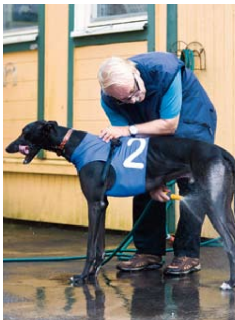
BARA VANLIGT VATTEN. Det skvätter om hundarna när de springer. Efter loppet är det dags att duscha av leran från tassarna.