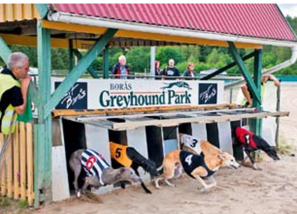
STARTKLART. Hundarna river upp så mycket grus i boxen att de måste blåsas rena efter varje start.

► den och vad ska jag göra? Det finns en centralorganisation där alla hundar är registrerade och man är ansvarig för sin hund tills den fyller tio år, även om den omplaceras. Vi tävlar kanske tjugo dagar om året, resten av tiden är hunden hemma och då vill man ju ha en trevlig hund. De får inte börja springa förrän de är femton månader. Då har man haft hunden i över ett år, den har blivit rumsren, varit en liten valp som sovit i min säng och är barnens favoritkompis. Om det visar sig att den inte springer så bra är den ju fortfarande min kompis. ■