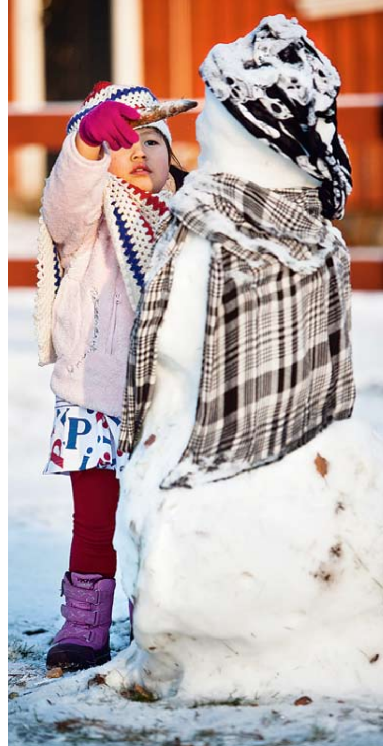
DET ÄR KLART att snögubben ska prydas med en morotsnäsa.