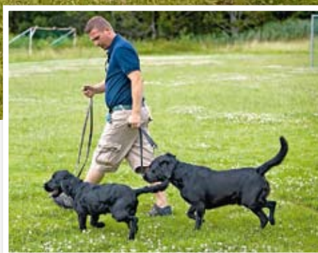
SLUTBRÅKAT. Här blir labradoren Fred och cocker spanieln Elmer vänner efter att ha bråkat.

med en tro på att hunden kommer att göra som man säger. Blir det fel får man hitta ett annat sätt att träna så att hunden förstår. Sedan belönar man rätt beteende.