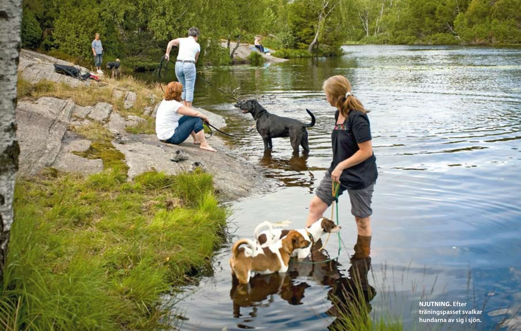
NJUTNING. Efter träningspasset svalkar hundarna av sig i sjön.